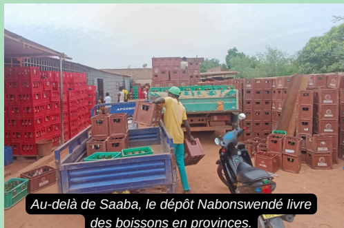
Au-delà de Saaba, le dépôt Nabonswendé livre des boissons en provinces.