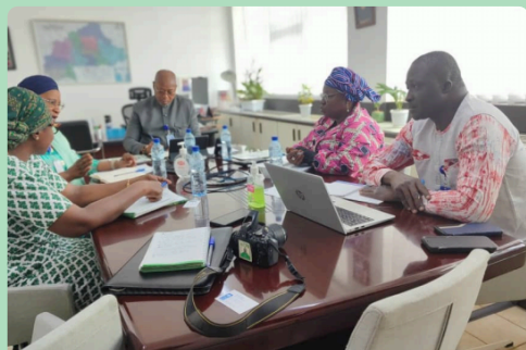
Séance de travail entre les équipes FCPB et PNUD

Le PNUD a décrit son engagement envers la gouvernance, la paix, la résilience, et l'accès à l'énergie, ainsi que sa collaboration avec le secteur privé pour soutenir le développement communautaire tout en soulignant l'importance de la digitalisation pour surmonter les défis de sécurité et faciliter l'accès aux services financiers.