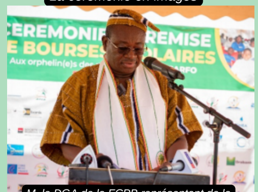
M. le DGA de la FCPB représentant de la marraine lors de son allocution