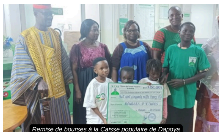
Remise de bourses à la Caisse populaire de Dapoya