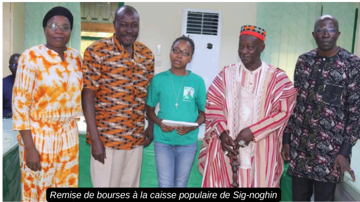
Remise de bourses à la caisse populaire de Sig-noghin