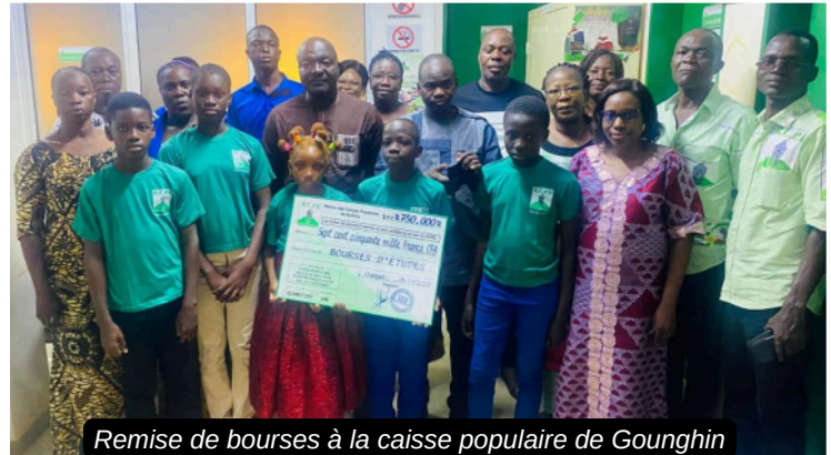
Remise de bourses à la caisse populaire de Gounghin