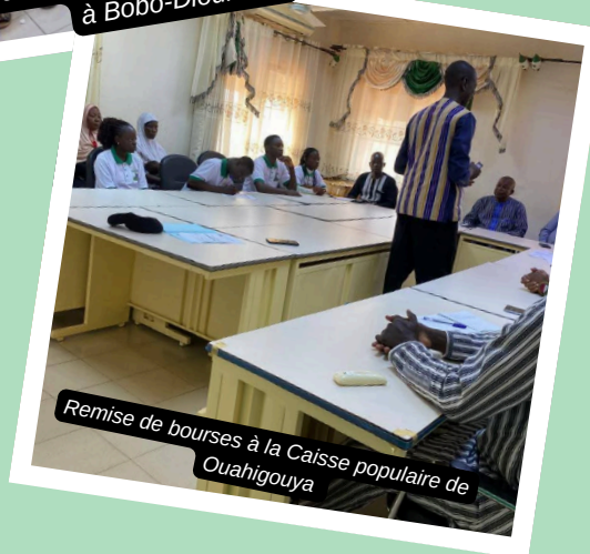
Remise de bourses à la Caisse populaire de Ouahigouya