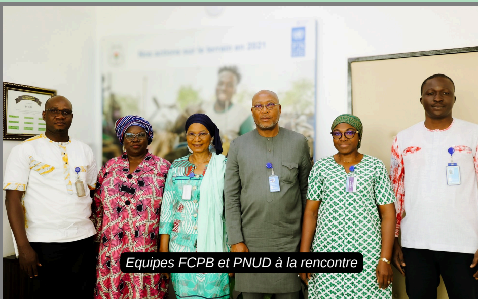
Equipes FCPB et PNUD à la rencontre

Les principaux participants comprenaient des représentants des deux organisations, qui ont discuté des collaborations réussies passées et exploré de nouvelles voies de coopération.