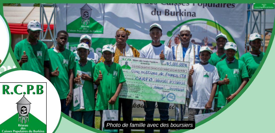
Photo de famille avec des boursiers