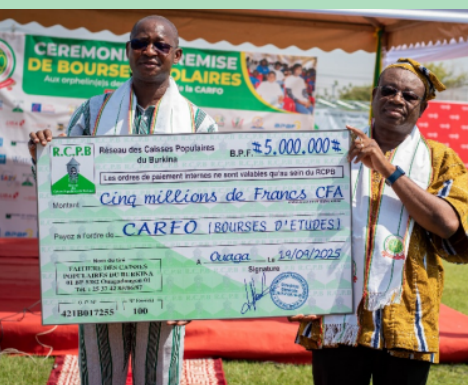
Remise symbolique de chèque au DG de la CARFO