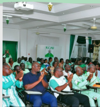
Les collègues, dirigeants et parents, témoins privilégiés de la cérémonie