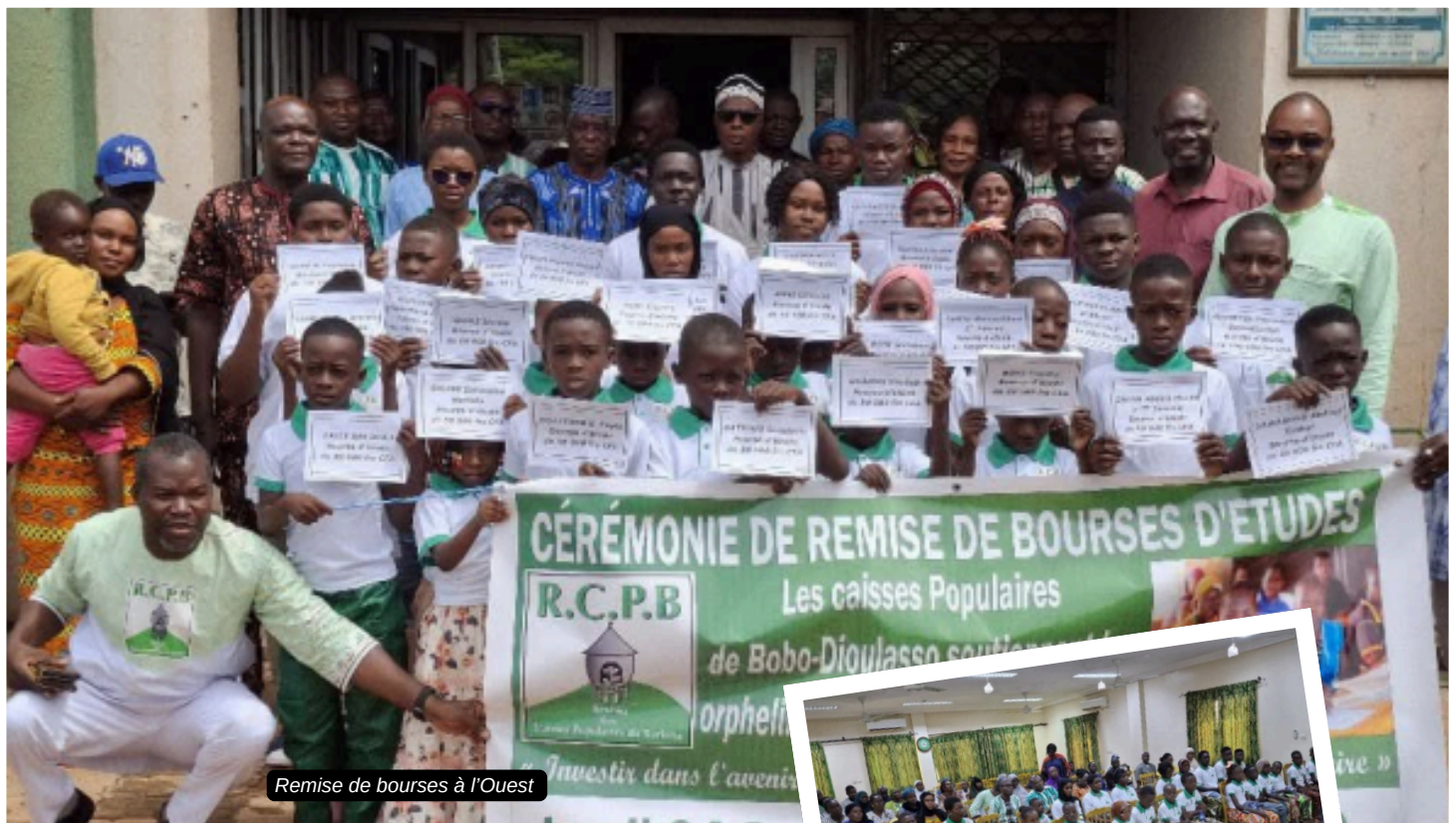
Remise de bourses à l'Ouest