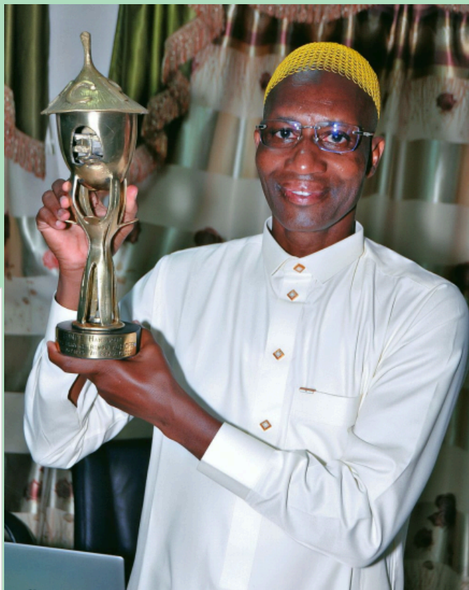
La cérémonie en images

Merci, et bravo pour cette carrière exemplaire !