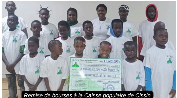
Remise de bourses à la Caisse populaire de Cissin