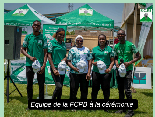
Equipe de la FCPB à la cérémonie