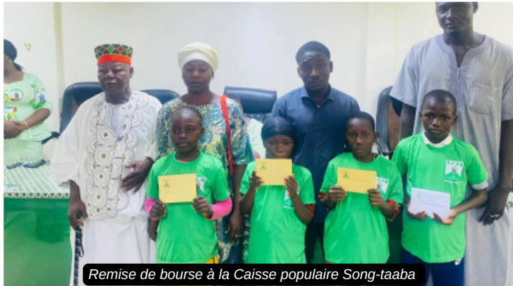
Remise de bourse à la Caisse populaire Song-taaba