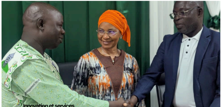
Innovation et services