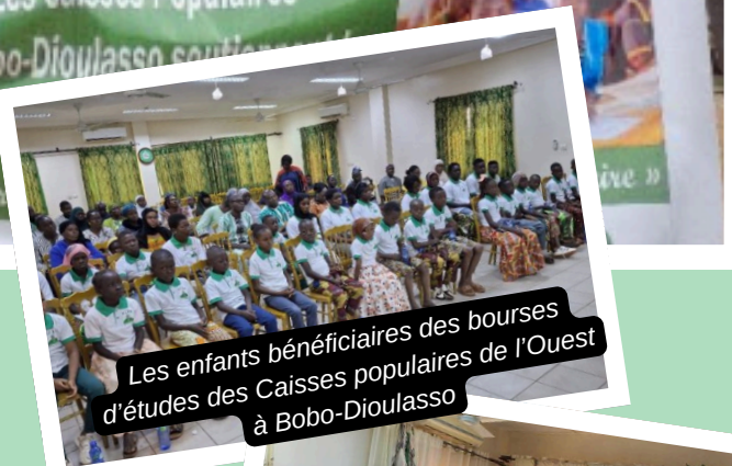
Les enfants bénéficiaires des bourses d'études des Caisses populaires de l'Ouest à Bobo-Dioulasso