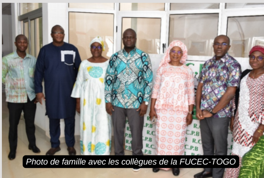
Photo de famille avec les collègues de la FUCEC-TOGO

Leurs centres d'intérêt se sont principalement orientés vers le marketing, la communication et la gestion des ressources humaines. En plus des échanges menés avec les équipes de la DRH et de la DMC, la délégation a effectué des visites dans les caisses populaires de Koudougou et de Cissin afin de s'imprégner de leurs bonnes pratiques en matière de reporting, d'animation commerciale et de gestion des équipes.